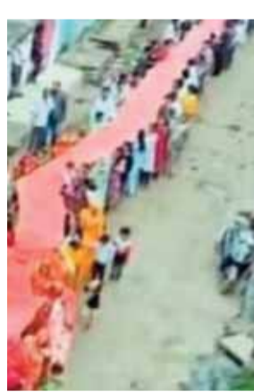
करते हुए खेर माता मंदिर पहुंची।

जबेरा। नवरात्रि की पावन अवसर पर शिव शक्ति दुर्गात्सव समिति पुराने अस्पताल परिसर में विराजमान मां महाकाली के द्वार से खेर माता मंदिर के लिए भव्य चुनरा यात्रा का आयोजन किया गया जिसमें ग्राम में भक्ति और उत्साह का अनेखा दृश्य देखने को मिला। यहां आयोजित भव्य चुनरा यात्रा में समस्त ग्राम वासियों ने बड़-चढ़कर हिस्सा लिया यह यात्रा पुराने अस्पताल परिसर से ग्राम में भ्रमण