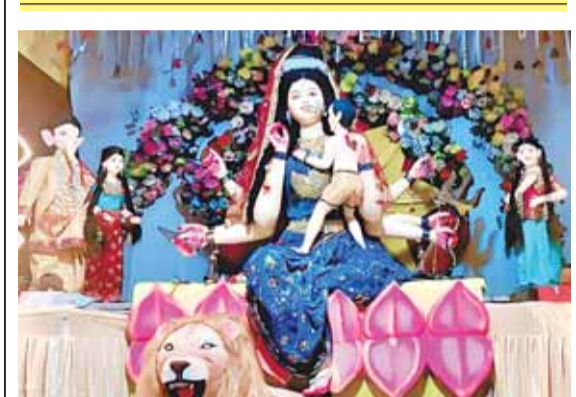
नवदुर्गा उत्सव समिति कुंडलपुर तालाब के पास